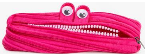
קלמר עם סגירת רוכסן - ריצ'רץ

ג. רוכסן (ריץ' רץ), ו סקוטש . דעת רוב הפוסקים דרוכסן דינו ככפתורים, ואין בו איסור אף כשדעתו לחבר לזמן ארוך, כגון חיבור ביטנה למעיל לכל ימות הגשמים (שש"כ פט"ו אות פ"ד, הגריש"א בשבות יצחק י"ד עמ' רכ"ח, פסקי תשובות ש"מ ל"ח, ועוד). אלא שבשבת הלוי החמיר בזה היכא שדעתו לזמן ארוך. וביושמע משה' (עמ' קעב) הביא מהגרי"מ שטרן שליט"א, דגם לדעת רבו השבט הלוי אין להחמיר