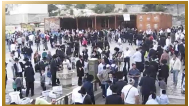
סוכה המונית בכניסה לרחבת הכותל המערבי

בשביל אכילה ושתיה. [ויש לציין, שאמנם הביא המשנ"ב שיש חולקים על הרמ"א, שבדיעבד יכול לאכול בסוכה שא"א לישון בה. אך סיים בשעה"צ שלכתחילה יש לזהר בזה מאד, מאחר שהרבה פוסקים הסכימו עם הרמ"א, ביניהם שר"ע הרב, בית הלוי, וחזו"א. ובחזו"א נקט דכן הוא גם דעת הרי"ף].