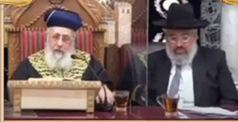
הרב המקדים: הרה"ג רבי ישראל מאיר ביטון שליט"א רב העיר חדרה