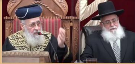
הרב המקדים: הרה"ג רבי יעקב זמיר שליט"א חבר ביה"ד הגדול