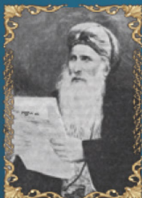
הרב רפאל מאיר פאניץ'ל י"ד בטבת ה'תרנ"ג (1893) היה הראשון לציון והחכם באשי, בעל מופת ושר"ר. מחותנו ה'יש"א ברכה' התמנה לראשון לציון תחתיו.