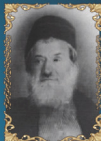
הרב חיים שאול הכהן דוויק ד' בטבת ה'תרצ"ג (1933) רבה הראשי של ארם צובא' שבסוריה. ובאחרית ימיו מראשי המקובלים בירושלים.