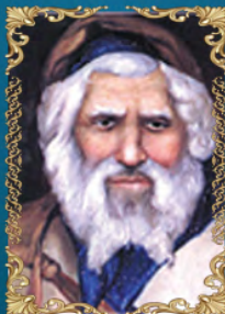
רבי יעקב אבוהצירא כ"ב טבת ה'תר"ם (1880) היה רבה של תאפילאלת ומגדולי רבני מרוקו. בעל מופת, סבו של ה'בבא' סאלי, מכונה 'אביר יעקב'.