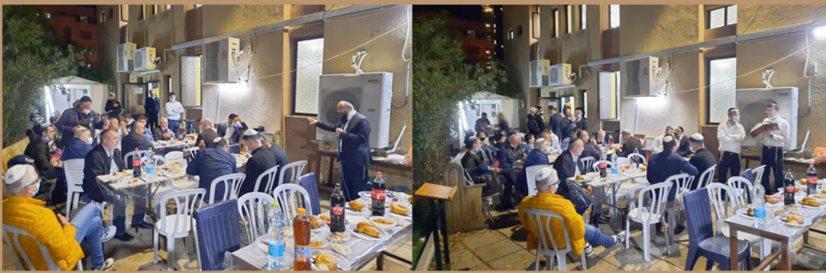
אזכרה בבית הכנסת "פועלי הרכבת" גבעתיים