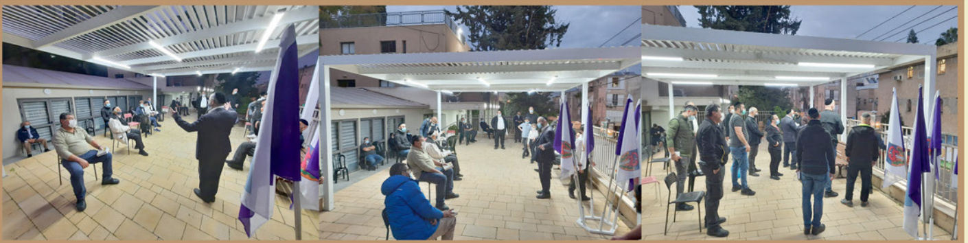
הדלקת נרות חנוכיה ע"י מתפללי "בית יוסף" ברחבת בית קובי גבעתיים