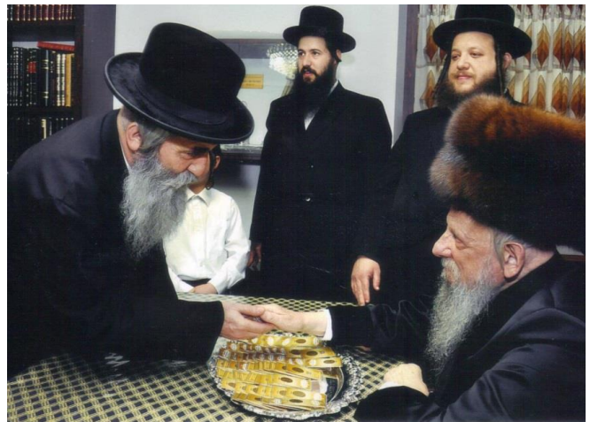
דמי חנוכה ע"י כ"ק מרן בעל ה'חכמת אליעזר' זצלה"ה