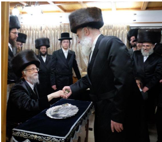
דמי חנוכה ע"י כ"ק מרן אדמו"ר שליט"א