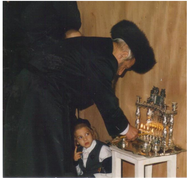
הדלקת הנרות ע"י כ"ק מרן אדמו"ר בעל ה'חכמת אליעזר' זצלה"ה