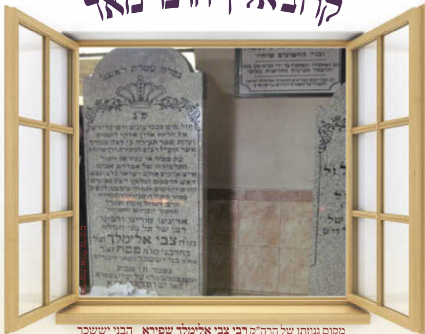
מקום גנותו של הרה"ק רבי צבי אלימלך שפירא הבני יששכר