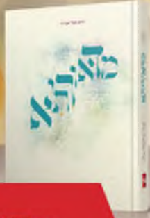
מדאורייתא כוחה של מילה אחת מאת הרב חיים אשר אפרתי שלישיית דמה טן