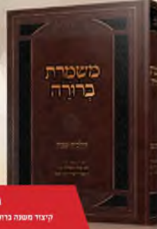
משמרת ברורה קיצור משנה ברורה לפי סדר השולחן ערוך הרבאית צוף