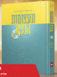
תעצמות הנפש חזרת הפסיכולוגיה בדרך ההודות אפרים בן יוסף שלישיית מאס הגומלינו הודיע הרב ירושלים