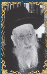
הרב רפאל כדיר צבאן ד' כסלו תשנ"ה (1994) רב העיר נתיבות, נשיא ישיבת 'כסא רחמים' ומגדולי רבני עולי תוניסיה.