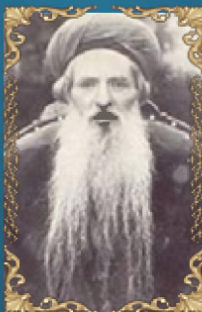
הרב חיים חזקיהו מדיני כ"ד כסלו תרס"ה (1904) מגדולי האחרונים, מחבר הספר 'שדי חמד' ורבה של חברון.