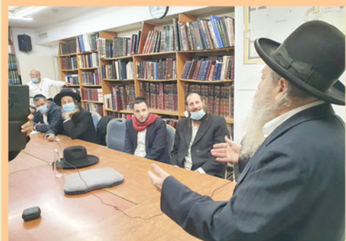
אבות ובנים / ובנות בלימוד חוויתי משותף בכל מוצאי שבת קודש לאחר ההבדלה

להנצחות ולהקדשות במייל: b5448622@gmail.com | sms: 054-4843340-z