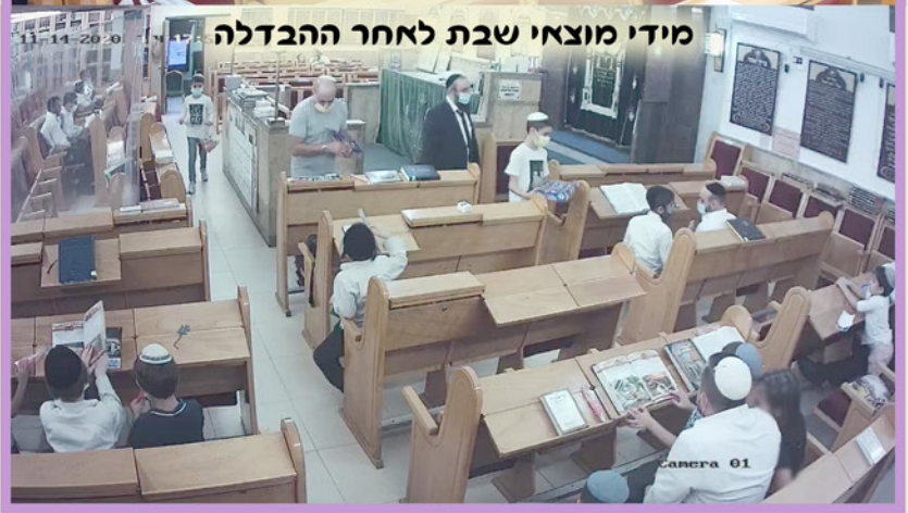
מידי מוצאי שבת לאחר ההבדלה

בית הכנסת המרכזי "בית יוסף" | רח' גלבווע 11 גבעתיים טלפון: 054-4843340 | מייל: b544862@gmail.com