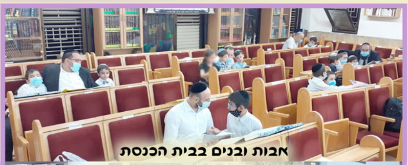
אבות ובנים בבית הכנסת