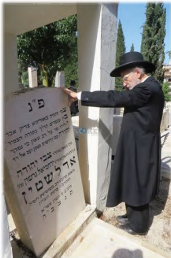
הגאון הגדול רבי יעקב אדלשטיין וצוק"ל על ציון אביו