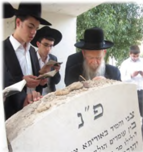
מרן ראש הישיבה הגר"ג אדלשטיין שליט"א על ציון אביו