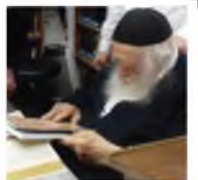
עלון מספר 4