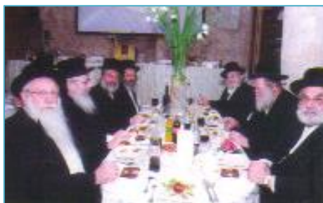
באסיפת עסקנים לטובת המוסדות