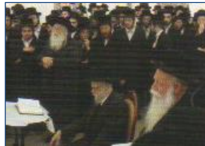
בתפלת מנחה בבארדיטשוב