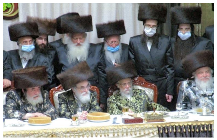
שולחן הכבוד בשמחה