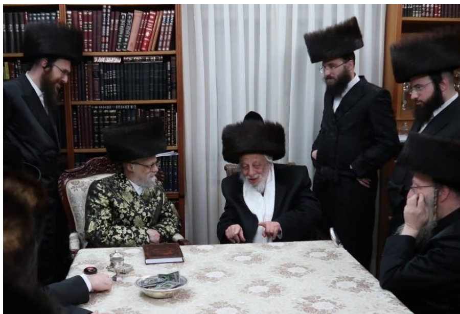
כ"ק מרן אדמו"ר שליט"א בשיחה לבבית עם כ"ק אדמו"ר מקאפישיניץ שליט"א