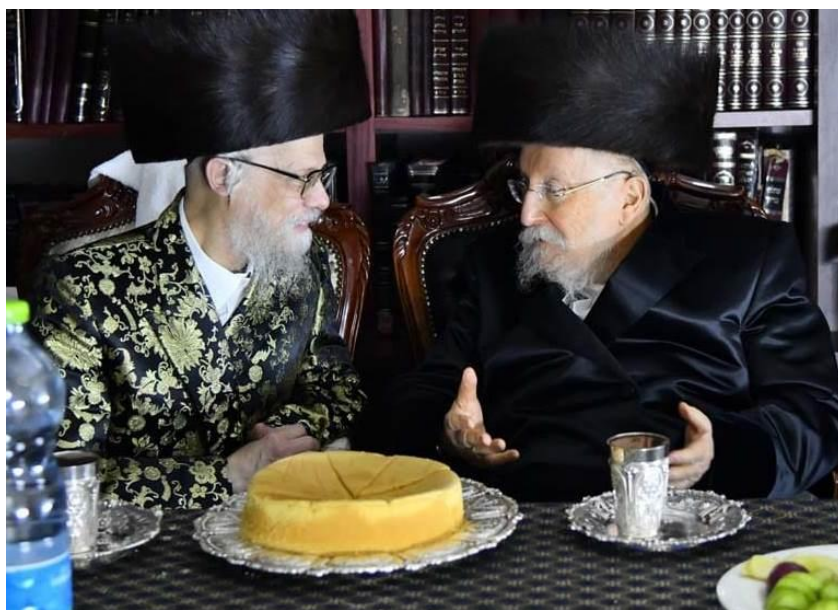
כ"ק מרן אדמו"ר שליט"א בסוד שיח עם כ"ק אדמו"ר מביאלא שליט"א