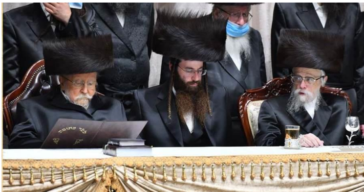
כ"ק מרן אדמו"ר מביאלא שליט"א מעיין בשטר הכתובה

בן כ"ק האדמו"ר מביאלא שליט"א, חתן כ"ק האדמו"ר מקאפישניץ שליט"א,