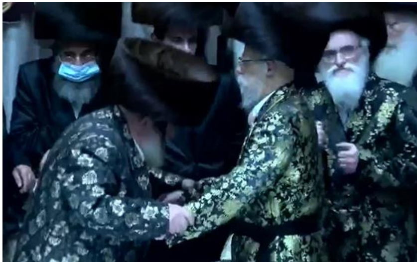
כ"ק מרן אדמו"ר שליט"א בריקוד עם כ"ק אדמו"ר מויז'ניץ שליט"א