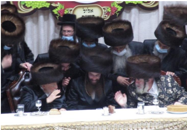
כ"ק אדמו"ר מויז'ניץ שליט"א בברכת לחיים' לכ"ק אדמו"ר מביאלא שליט"א