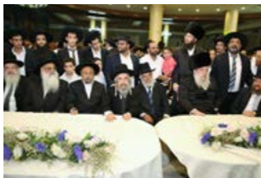
בשמחת בית השואבה