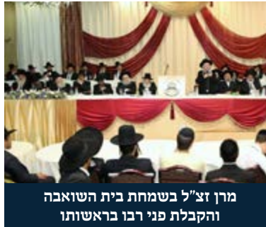
מרן זצ"ל בשמחת בית השואבה והקבלת פני רבו בראשותו