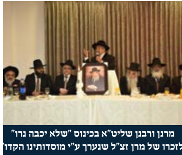
מרנן ורבנן שליט"א בכינוס "שלא יכבה נר" לזכרו של מרן זצ"ל שנערך ע"י מוסדותינו הקדור

דרכי חשיבתו והלך רוחו היו באופן אישי ומקורי שהפליאו גדולים וטובים. הוא התרחק מליקוטים, וכל מלה בספריו חצובה מהגייוני לבו. בדרך בדיחותא היה נוהג לומר, כי אילו חיבר ספרים על ידי ליקוט - היה מוציא לאור ספר בכל חודש.