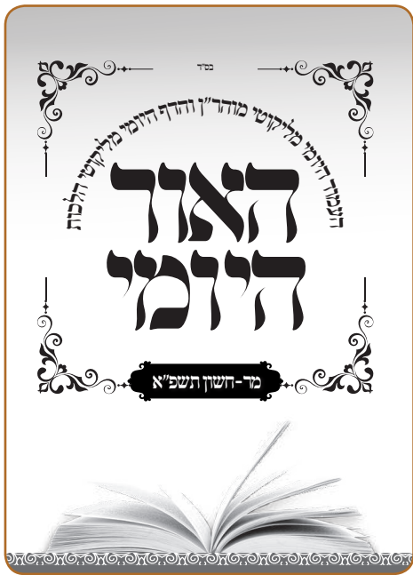
מחפכה בלימוד הספרים. שיער החוברת "האור היומי"

כאשר אין ספק שאותם הלומדים בחוברת הקד' חייבים משתנים לגמרי, וכפי שידועים דבריו של רבי נתן שכתב בגדולת הלימוד בספרי רביה"ק (חיי מוהר"ן סי' שפ"ח): "כי העיקר תורה שלו היא להנשמות שלנו. שכשנבוא לעולם הבא יהיו הנשמות שלנו בקיאים באותם התורות הגבוהים מאוד. גם בעולם הזה צריך לקיימם בפשיטות על כל פנים, לילך בהם, כאשר שמענו מפיו הקדוש כמה פעמים שצריכים לילך עם אותם התורות, דהיינו לילך איהו זמן עם זאת התורה, וכל העבודות שלו מבוקר עד ערב יהיו עם הילוך של אותה התורה שהוא הולך בה בעת ההוא".