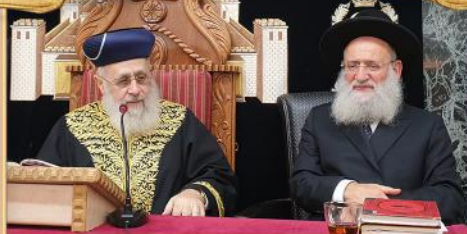
הרב המקדים: הגאון הגדול רבי ראובן אלבו שליט"א ראש ישיבת "אור החיים" וחבר מועצת חכמי התורה

שיעורו השבועי של מרן הראש"ל הרה"ר לישראל אב"ד בביה"ד העליון הגאון הגדול רבי יצחק יוסף שליט"א נשיא מועצת הרבנות הראשית לישראל