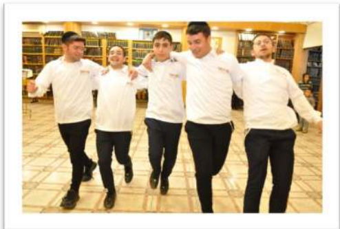
חג שמחות בית-השואבה..

אפשר שרמזו רמזה כאן התורה: אם רצית שהתורה לא תישכח מפי זרענו - כדאי שתהיה זו "שירה". אם תהיה ניגון, אז יהיה קשה להפסיק. איך אומר העולם? את המנגינה הזו אי-אפשר להפסיק..