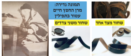
תמונה נדירה: מרוך החפץ חיים עטור בתפילין

נוי תפילין: מחדש הרמב"ם (תפילין פרק ג הלכה יד) וז"ל 'ולא יהיה אחורי הרצועה לעולם, אלא כעין הקציצה אם ירוקה ירוקין ואם לבנה לבנים, ונוי הוא לתפילין שיהיו כולם שחורות הקציצה והרצועה כולה'. והיינו שלדעת הרמב"ם יש ענין לצבוע בשחור מבפנים מצד נוי התפילין, אך אינו מכלל הלכה למשה מסיני. וכן הביא בדברי משה (אות ב) מה שכתב האור זרוע (חלק א