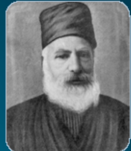
הרב סלמאן אליהו ב' תשרי ה'תש"א (1940) מרבני עולי עיראק ומתלמידי ה"בן איש חי" אביו של הראשון לציון רבינו מרדכי אליהו זצ"ל