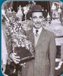
הרב בנימין גרג'י ו' תשרי תשל"ה (1974) רבה של העדה האפגנית ועדת עולי משה' בישראל, מחנך דגול במשך כ־30 שנים בת"ת "בני ציון" י-ם