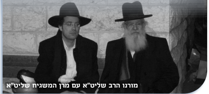
מורנו הרב שליט"א עם מרן המשגיח שליט"א

זכנו ה' יתברך לצעוד לאורו ולהינות מזיו תורתו ומוסריו המאירים עוד רבות בשנים, בבריאות איתנה. אכ"ר.