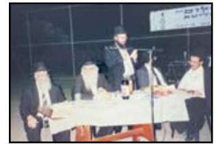
בכינוס חיזוק בעיר נס ציונה - נראה ראש המוסדות הרב יהורם יפת שליט"א