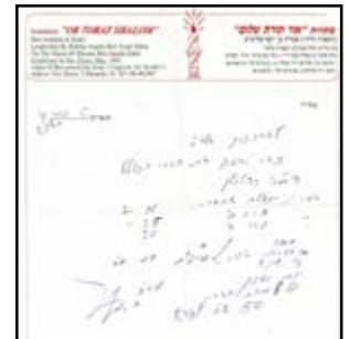
מכתב חיזוק וכללים לאברכי הכוללים