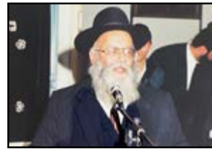
רבינו נואם במסיבה בבית מדרשינו