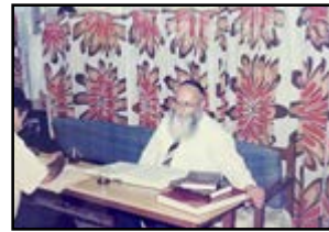
רבינו זצ"ל בלימוד בהיכל בית מדרשינו