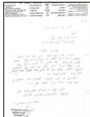
מכתב כתי"ר רבינו בבקשת תמיכה ממשדד הדתות