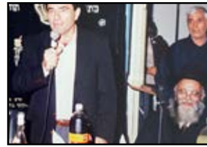
בכינוס בבית מדרשינו, נואם ראש העיר נס ציונה

המעוניינים להקדיש את הגליון לעילוי נשמת, רפואה שלימה, הצלחה וכו', וכן המעוניינים לסייע בהפצת הגליון באיזור מגוריהם, יפנו למערכת הגליון.