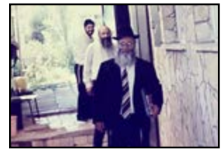
רבינו ביציאה מהיכל בית מדרשינו בעיר נס ציונה