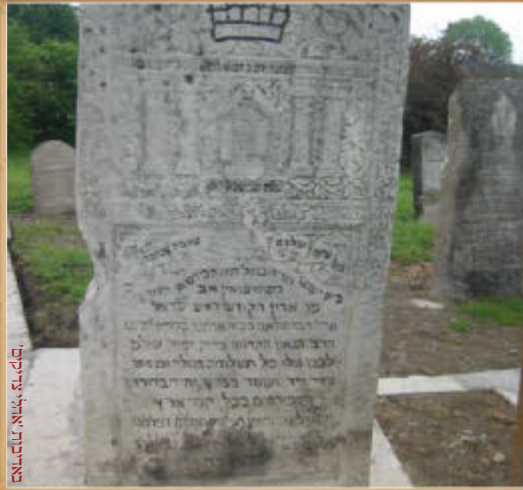
מקום גנותו של ה'שר שלום' מבעלזא