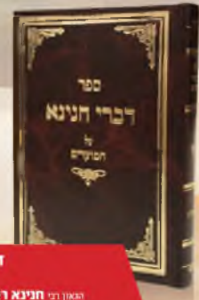
דברי חנינא על המועדים האנן רבי חנינא רוטנברג שלישי'א בית גן - ירושלים