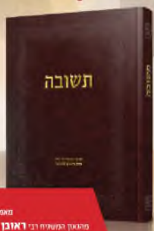
תשובה מאמרים בנושא תשובה מהאנן המשפחה רבי ראובן לייבנר שלישי'א ירושלים