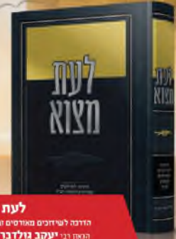
לעת מצוא הדרכה לשיחיים מאורסים ובניין הבית האנן רבי יעקב גולדברג שלישי'א ירושלים