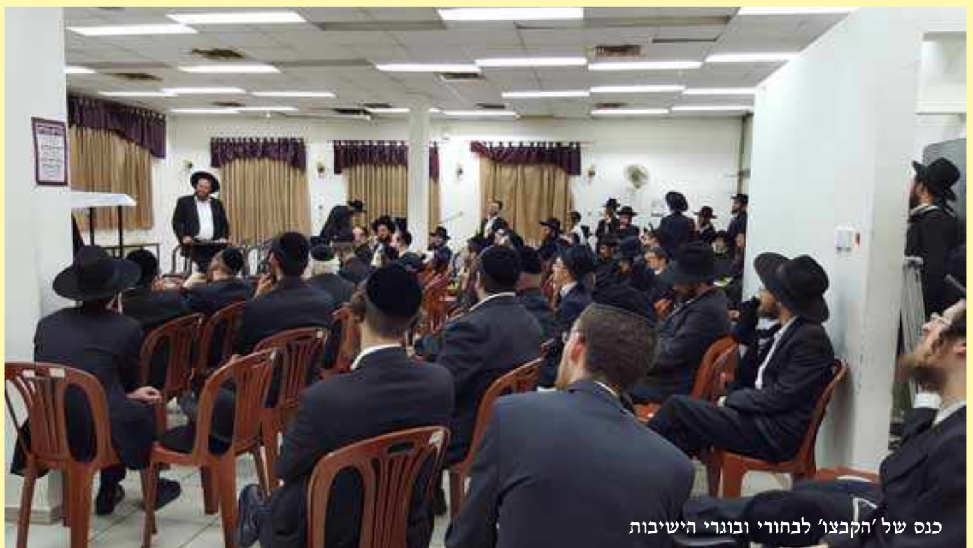
כנס של 'הקבצו' לבחורי ובוגרי הישיבות