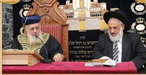
הרב המקדים: הרה"ג רבי אבירם הלוי שליט"א אב"ד תל-אביב

שיעורו השבועי של מרן הראש"ל הרה"ר לישראל אב"ד בביה"ד העליון הגאון הגדול רבי יצחק יוסף שליט"א נשיא מועצת הרבנות הראשית לישראל