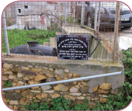
כל הסגולות והרפואות. הקבר המיוחד לבעל הטורים

'כך?' שאל ה'שר שלום', והחל לגלות סודות מכבושנו של עולם: 'דע לך בני, כי ב'טור' ו'בית יוסף' יש את כל הרפואות שבעולם!!! רבינו יעקב בעל