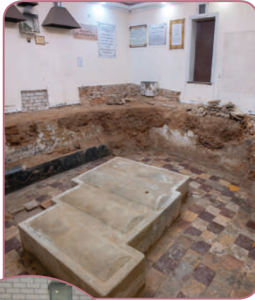
התרגשות גדולה: המצבות המקוריות והציון לפני התגלית

מדובר ללא ספק בציונו המקורי של הצדיק מברדיטשוב, ועצם גילויו מעורר התרגשות רבה בכל רחבי תבל. למעשה מקומה של המצבה הוא עמוק מתחת לאוהל המקורי, במרחק מסוים ממה שהיה מיוחס בשנים האחרונות כמצבת הצדיק. כך יצא שמי שהתפלל ליד ה"מצבה" השגויה, דרך - בשגגה כמובן - על קברו של הצדיק.