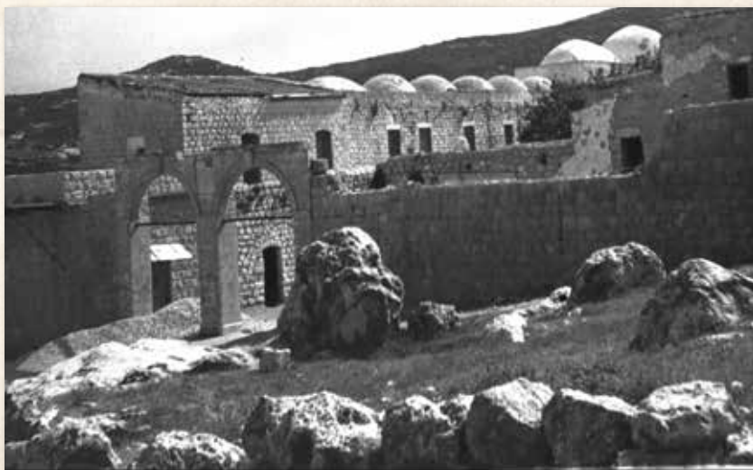
ציון הרשב"י במירון בימי קדם