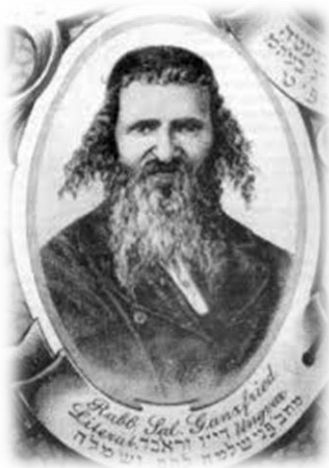
בעל הקיצור שו"ע