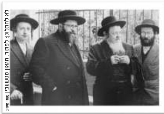
לא להתלונן; לפתור. הגאון מטשעבין (1810-1880)