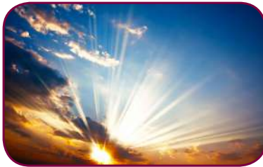
מנחם את קטני המעלה. זריחת השמש ביפעתה