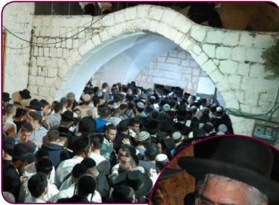
לא פחד: הרב אברג'ל והאלפים בהילולא בשכם