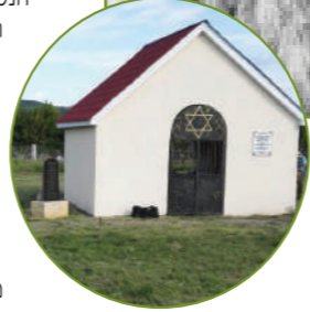
סיפור מצמרר. רבי שלמה גנצפריד זצוק"ל

עומד וחש קירבה למקום, התפלאותו וסקרנותו גברה כאחד, והוא שאלו: 'מה שמך?'