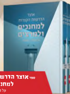
ספרי אוצר הדרשות הקצרות למחנכים ומרצים

על חמשה חומשי תורה מבוסס ע"פ גליונות אפריון שלמה