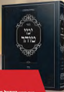
ספרי ימי טוהר הלכות נדה