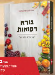
ספרי בוא רפואות טעולות ואוצרות הבריאות מהצומח ע"פ המקורות על התורה

על חמשה חומשי תורה מבוסס ע"פ גליונות אפריון שלמה