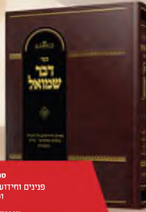
ספרי דבר שמואל פנינים וחידושים על התורה נביאים וכתובים ש"ס ומעשיות.