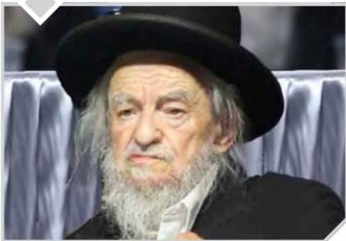
מיד העניק תרומה בסך חמש מאות דולרים!...

"שְׁמַעוּ נָא בְּנֵי יוֹי" (במדבר ט"ז, ה')