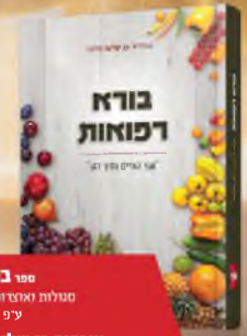
ספר בורא רפואות

על חמשה חומשי תורה מבוסס ע"פ גליונות אפריון שלמה