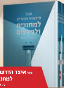
ספר אוצר הדרשות הקצרות