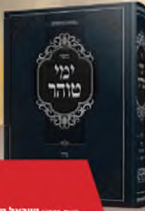
ספר ימי טוהר הלכות גדה