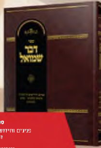
ספר דבר שמואל

פנינים וחידושים על התורה נביאים וכתובים שיש ומעשית.