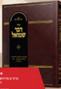
ספר דבר שמואל

פנינים וחידושים על התורה, נביאים וכתובים שיש ומעשית.