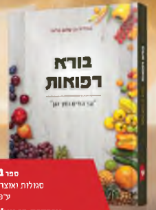
ספר בורא רפואות

על חמשה חומשי תורה ממסס ע"פ ליומנות אפריון שלמה