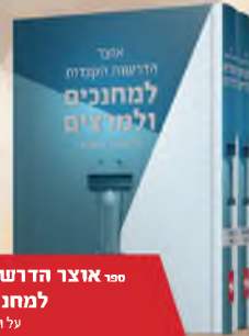
ספר אוצר הדרשות הקצרות