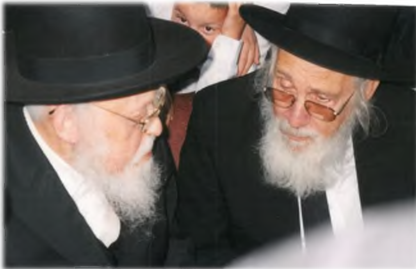
עם מרן הגר"י ש אלישיב זצ"ל

פעם לבית אחד מרבני החשובים של שכונת בית וגן, וביקש מאותו רב כי ישוחח עם מספר יהודים עשירים בפנמה כדי שיסייעו