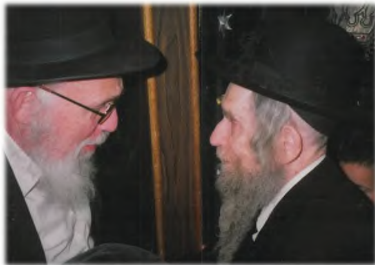
עם מרן הגר"י ל שטיינמן זצ"ל

ככל הנראה מצאו הדברים מסילות אל לב התושבים, אך כשהגיעו לידי מעשה, לא הייתה היענות במידה מספקת ובלב רחב, כפי שציפה הבן. הוא תהה האם דבריו של אותו רב לא הניבו פירות דיים, אך עד מהרה הבין הכל... היה זה לאחר מספר ימים, כאשר קיבל אותו רב שיחת טלפון מאחד מראשי הכוללים בפנמה: "כבוד הרב", התלונן ראש הכולל, "מדוע לא אמרתם לנו מראש שזהו בנו של בעל 'שמירת שבת כהלכתה'? בשיחה המקדימה הבהרתם שמדובר בבנו של הרב נויבירט. לא קלטנו בתחילה במי המדובר. אילו הייתם מדגישים כי זהו בנו של ה'שמירת שבת כהלכתה' היינו מעניקים לו מיד בהתחלה את מלוא תשומת הלב והעזרה..."