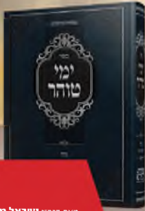
ספר ימי טוהר הלכות גדה