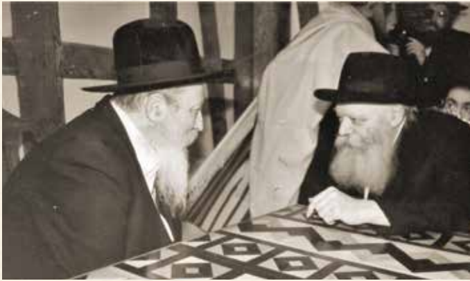
בסוד שיח. כ"ק אדמו"ר מגור שליט"א באחד מביקוריו אצל הרבי