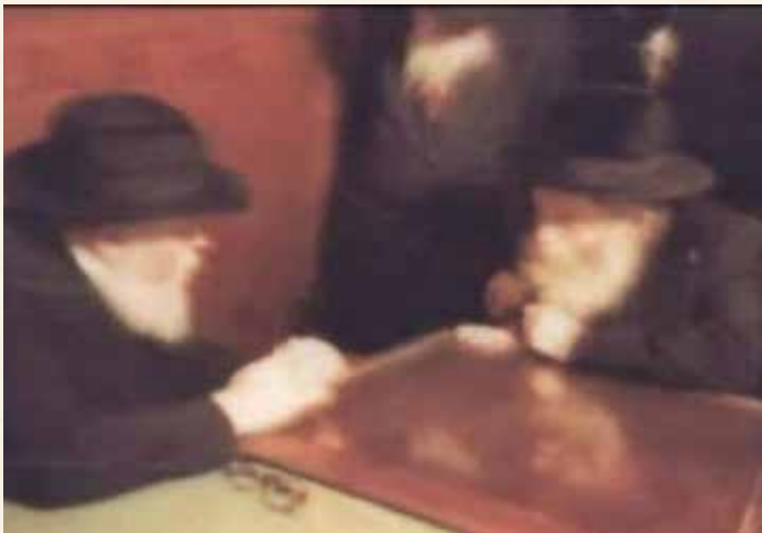
שיחה תורנית ארוכה. כ"ק אדמו"ר בעל 'פני מנחם' מגור זצוק"ל באחת מפגישותיו עם הרבי