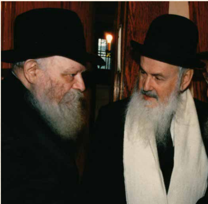
מוקיר רבנן. רבה הראשי של ירושלים עיה"ק ומלפנים רבה הראשי של קזבלנקה, הגאון רבי שלום משאש זצ"ל, בפגישה עם הרבי

במסגרת היריעה הנוכחית לא נוכל כמוכחן לסקור את כל מאה וארבעים הדמויות שקשריהן עם הרבי מתוארים בארבעת כרכי הסדרה. התמקדנו אפוא בכמה בודדים המלמדים על הכלל כולו. אולי נפתח בדמותו של פוסק הדור, הגרש"ז אויערבאך זצ"ל. ידוע שאכן היה ר' שלמה זלמן אהוד ומקובל על כל החוגים. עם זאת, היותו ענק בתורה שכל הווייתו בעולמה של היהדות הליטאית, לא היווה סתירה לאהדה וההערצה הגלויה שביטא כלפי הרבי?