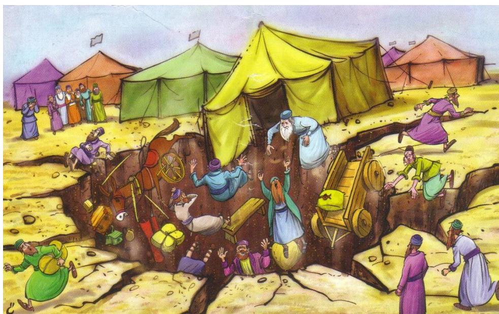
בליעת קורח ועדתו