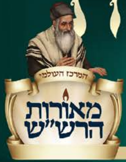
יוצא לאור ע"י

בעקבות ספר התורה מבית גיליונות 'גנזי מלכים'