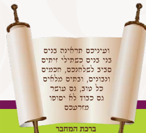
בְּרַכַת הַמַּחְבֵּר מִתּוֹךְ הַקְּדִמַת הַסֵּפֶר

יִתְּן לְתוֹרָם 24 שְׁעוֹת בִּימַמָּה ע"י מַעֲרַכַת מִמוֹחֶשֶׁת מְאוּבַחַחַת