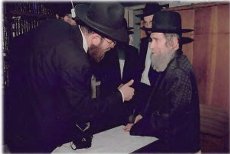
עם מורדו ורבו מרן הגרא"ל שטיינמן זצ"ל