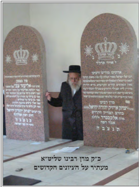
כ"ק מנחם רבינו שליט"א מעתירי על הציונים הקדושים

כהנים, צלל במים אדירים והעלה אבני נזר יקרים, יגע בכל כוחו והיה ה' מבטחו, ויתן עליו את רוחו לברר וללבן דברי חכמים, כי לא ימנע טוב להולכים בתמים.