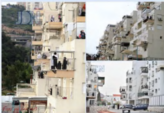
מניני המרפסות בחיפה ואשדוד...