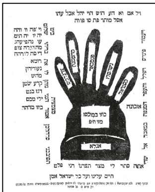
קמיע מספר 'אדם ישר' דפו"ר