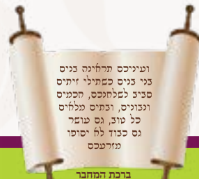
ברכת המחבר מתוך הקדמת הספר

שיעור קבוע בספר הקדוש והמסוגל זרע שמשון בשכונת תלפיות בירושלים בבית מדרש ברוחב דרך חברון 108