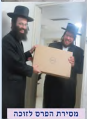
מסירת הפרס לזוכה