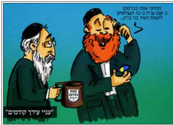
"... וכן עניינת הצדקה, יש לנו על זה תירוץ הנון כי חייך קודמין, ואין קץ ושיעור לחיך... ואין ענייניו צעיר העני... וכל אחד עושה היתר לעצמו באיסור חמור זה (ובל עניינת הצדקה) ואין נשאלים לשררה אך לעצמת מצותה רבה הלו"ו" (ספר אבות הרשב"א הלכות שו"ת סי' ט"ד)

נאלץ למכור כל מה שהיה לו בבית, לרבות את תכשיטי אשתו. ביום הביר אחד נאלץ להודות באוני אשתו, כי הוא נשאר בלי פרוטה ולפורטה ולא נותר לו רק ללכת ולקבץ נדבות. הוא העמיד אותה בפני הברירה האכזרית: או שתיתול אף היא תרמיל של קבצנים ותצא לדרך, או שתותר על כתובתה ותיקח גט. האשה, שזה מוזמן נקעה נפשה מקמצנותו של הבעל,