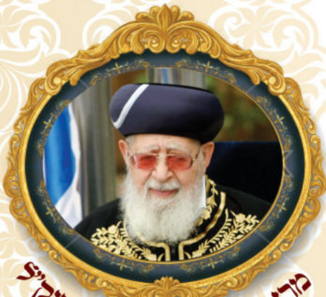
מרן הרב עובדיה יוסף יצחקי

סיפר הרב חיים זאיד שליט"א, אחד מתלמידי למד שיעורי נהיגה. והנה לפני כמה שבועות הוא ביקש ממורה הנהיגה לערוך 'שיעור כפול'. היום מחיר של שיעור נהיגה הוא בערך 130 עד 150 ש"ח, כך שהשיעור הכפול הגיע למחיר של כ-300 ש"ח. הם החלו בשיעור הראשון, ולא עוברות כמה דקות מתחילת השיעור והנה הם מוצאים את עצמם בפקק גדול – מה מתברר? ... היה זה אותו יום של הפגנות כבדות בכבישים כמחאה על הסערה שהיתה עם הבחור האתיופי, כך שהם נעמדו באותו מקום במשך 3 שעות!