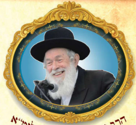
הרב יצחק זילברשטיין שליט"א

לאור זאת, נוכל להסיק בשאלתנו, שהיות והשלשה היו שתפים בכרטיס השלישי שעמד להפקת רווחים, נתן לתלות שמוזל שלשתם גרם לזכיה, ולכן יחלקו ביניהם את הזכיה שוה בשוה. לסכום: כל אחד מהשלשה יקבל שלישי מדמי הרב.