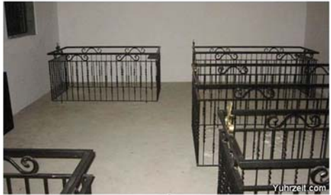
מקום נחלתו בביר

מילא מקומו אך שב למקום זקנו לשילובצא, ובה כהן כאב"ד והנהג את העדה ביד רמה כשבע שנים משנת תרע"ב עד שנת יום הסתלקתו לגזי מרומים כ"ד שבט שנת תרע"ט. כזקיניו הקדושים אף הוא לא האריך ימים. נשאר אחריו בנו הרח"ק ר' חיים ישראל שלום יקותיאל משידלובצא זי"ע. זכותו הגדול יגן עלינו ועל כל ישראל אמן. מתורתו של רבינו זי"ע במס' בבא בתרא צ"א: אר"ח בר רבא אמר רב אותו היום שנפטר אברהם אבינו ע"ה מן העולם עמדו כל גדולי אוה"ע בשורה ואמרו אוי לו לעולם שאבד מנהיגו ואוי לו לספינה שאבד קברינטא. ויש להבין למה המשילו אותו למנהיג העולם ולמנהיג הספינה? וי"ל כי כונתם היה להגדיל את גודל האבדה שאבד מהם, כי מצינו בין הצדיקים יש שעובדים עבור הפרט לבד, ויש שעובדים עבור הכלל לבד, ויש צדיקים שעובדים עבור הכלל והפרט. ואצל אאע"ה מצינו שעבד עבור כלל העולם כדברי המדרש רבה פרשת לך: שהי' הולך ממקום למקום להפיץ אחדותו ית"ש בכל העולם והי' רוצה בטובת כל העולם כולו, וגם הי' משתדל לטובת הפרט כמו שמצינו בתורתנו הקדושה: ואת הנפש אשר עשו בחרן שהכניסם תחת כנפי השכינה. וממילא יוצדק לפי זה שהמשילו אותו למנהיג העולם, ר"ל שהיה משתדל לטובת כל העולם בכלל, ולקברינטא של ספינה שמנהיג רק את הפרט. כן היה כ"ק אבי אדמו"ר זצ"ל עד הרגע האחרונה לא אז מתוף רעיונו צרות הכלל והפרט.