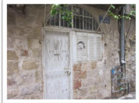
אתבן עיל ישראל, בית רבי אריה לוויין צ"ל

המרחק היה הגוון, אבל רבי אריה הציע ללוותו ליעדו. הוא צעד עמו ושוחח אתו בנעימות וחביבות, כדרכו, התעניין בו ובפשר מעשיו, כל זאת בלי שום מילה על יהדות ושבט. האיש, תושב חו"ל, נבוך קמעא להחזיק סיגריות בצעידתו עם רב בשבת, והוא השליכה ארצה. לאחר פרק זמן קצר, הוציא גם ממחטה זעירה מכיסו והניחה על ראשו. הרי לא יאות ללכת עם רב בלי כיסוי-ראש.